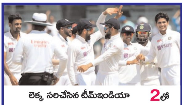
లెక్క సరిచేసిన టీమ్ ఇండియా 2